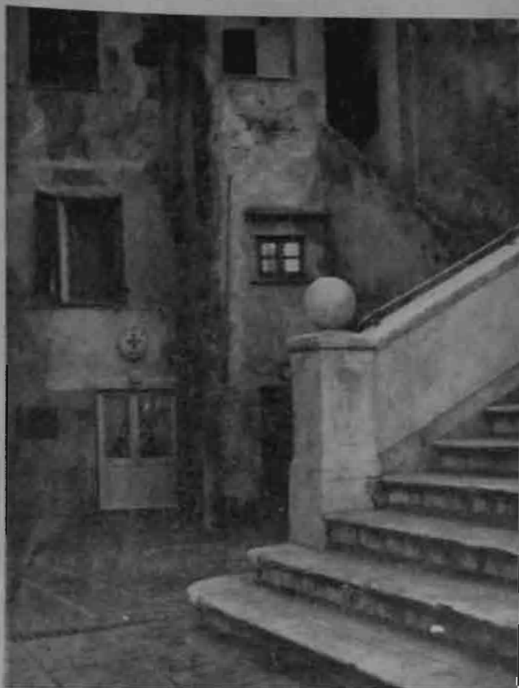
Un angolo del Mandraccio ridotto a terra ferma al lato dell'imponente marmorea scala della nostra chiesa.