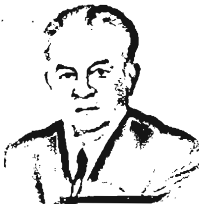
GIO BATTISTA MARTINI